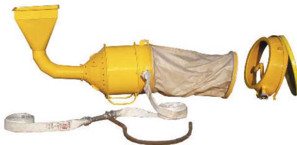
Малогабаритная водо-пенно-порошковая установка

В настоящее время заканчиваются испытания на лабораторной базе «Росхимзащита» опытных образцов, доводка (подготовка к производству) дыхательной аппаратуры с длительным защитным действием — самоспасателя, респиратора. Это — инвестиционный проект Кузбасского технопарка в сумме 60 миллионов рублей.