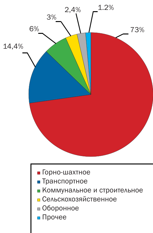
Диаграмма 1. Структура машиностроения Кемеровской области. 2010 год