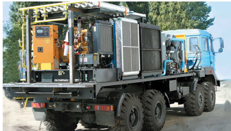
Первая многофункциональная азотная станция пожаротушения ТГА 9/15 С99

Рабочий диапазон температур окружающей среды — от -40 до +45 °С. Гарантийный срок службы газоразделительных мембран в установке — 180 000 моточасов (20 лет) непрерывной работы до ухудшения свойств мембран.