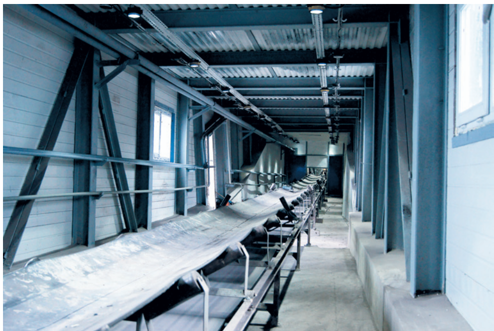
Новая система топливоподачи будет бесперебойно снабжать котельную углем

Бесперебойное и безаварийное теплоснабжение — дело затратное. Общий объем инвестиций ООО «ХК «СДС-Энерго» в этот проект оценивается в сумму более миллиарда рублей, при этом на текущий момент профинансировано работ на сумму более 860 млн рублей. Эти средства, по мнению руководства ХК «СДС-Энерго», вложены наилучшим образом — в повышение качества жизни людей.