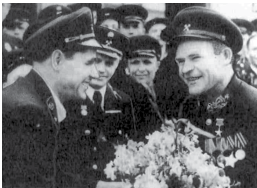
Встреча с донбасской делегацией. 1948 г.